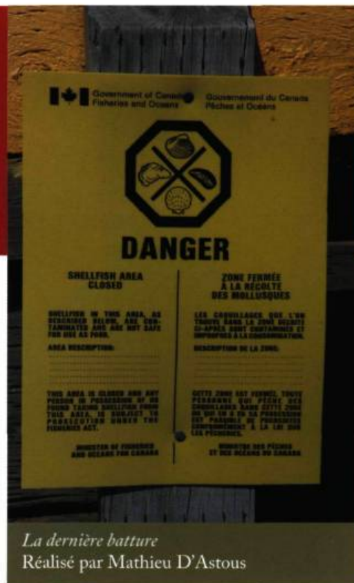
La dernière batture Réalisé par Mathieu D'Astous

La situation est grave, inquiétante et on le sent. Pourtant, le ton n'est pas alarmiste et probablement à l'image de l'état d'âme des pêcheurs et des familles du Nouveau-Brunswick. Ils sont touchés de près, mais ils gardent cet espoir, peut-être aveugle, que la situa-