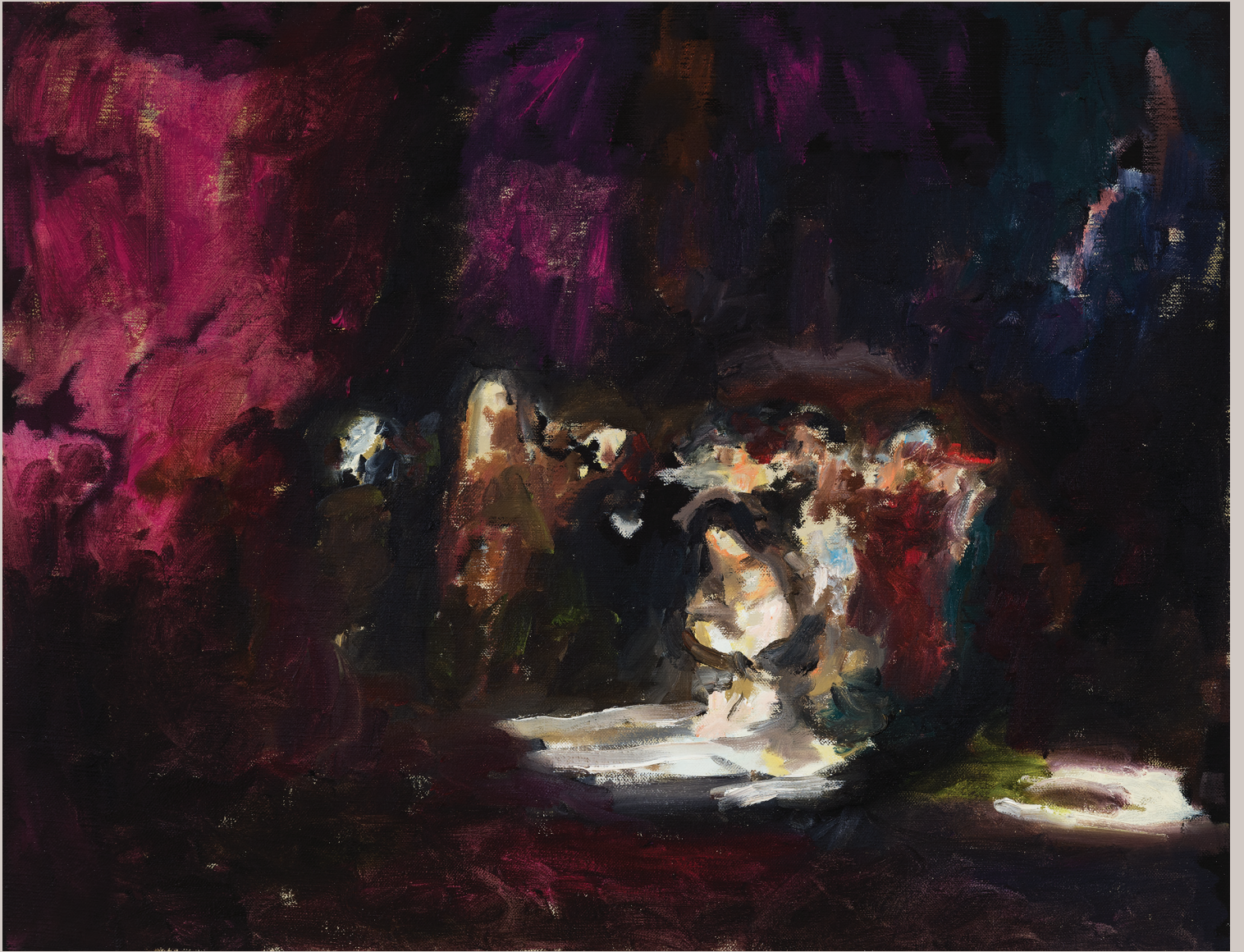
Dans le vide comme des temples flottants n° 8, 2015. Huile sur lin. 44 x 57 cm.