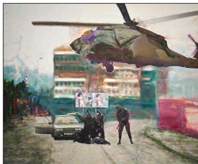
Transpolitique , 2009. Huile sur lin. 110 x 137 cm. Porno AM , 2010-2011. Huile sur lin. 265 x 330 cm. Néopolice , 2010-2011. Huile sur lin. 207 x 257 cm.