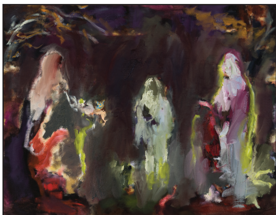
Sans titre n° 3 , 2015. Huile sur lin. 44 x 57 cm. Sans titre n° 4 , 2015. Huile sur lin. 44 x 57 cm.

non seulement une lecture du monde, mais tout le travail exploratoire qui sous-tend celle-ci. Il sera intéressant de suivre les prochaines évolutions de l'œuvre de l'artiste, dont le registre s'est élargi de façon étonnante et mystérieuse entre ses séries les plus récentes. ■