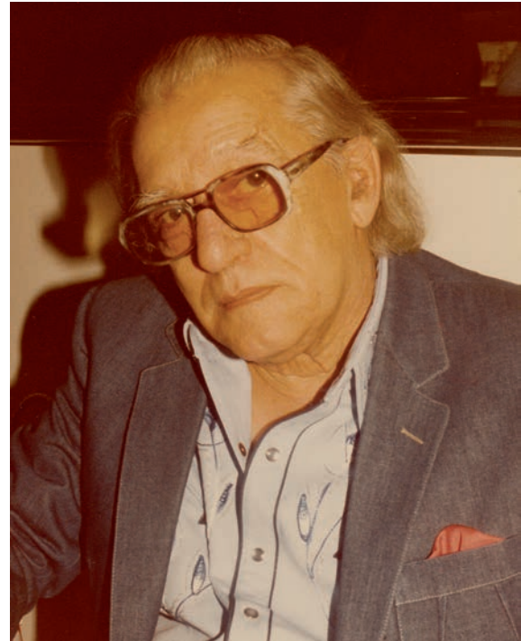
Yves Thériault à la fin des années 1970.

N'ayant pas lu Contes pour un homme seul ou ne me souvenant pas de l'avoir fait, je devais remédier à cette carence. Je me suis risqué sur la pointe des pieds, un soir de lune. La parole qui se faufile entre l'oralité et l'écrit m'a saisi. Thériault se fait shaman, manipule la langue et la met à son service. J'aime les contes, tout le