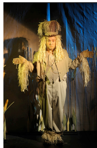
Les mécaniques célestes