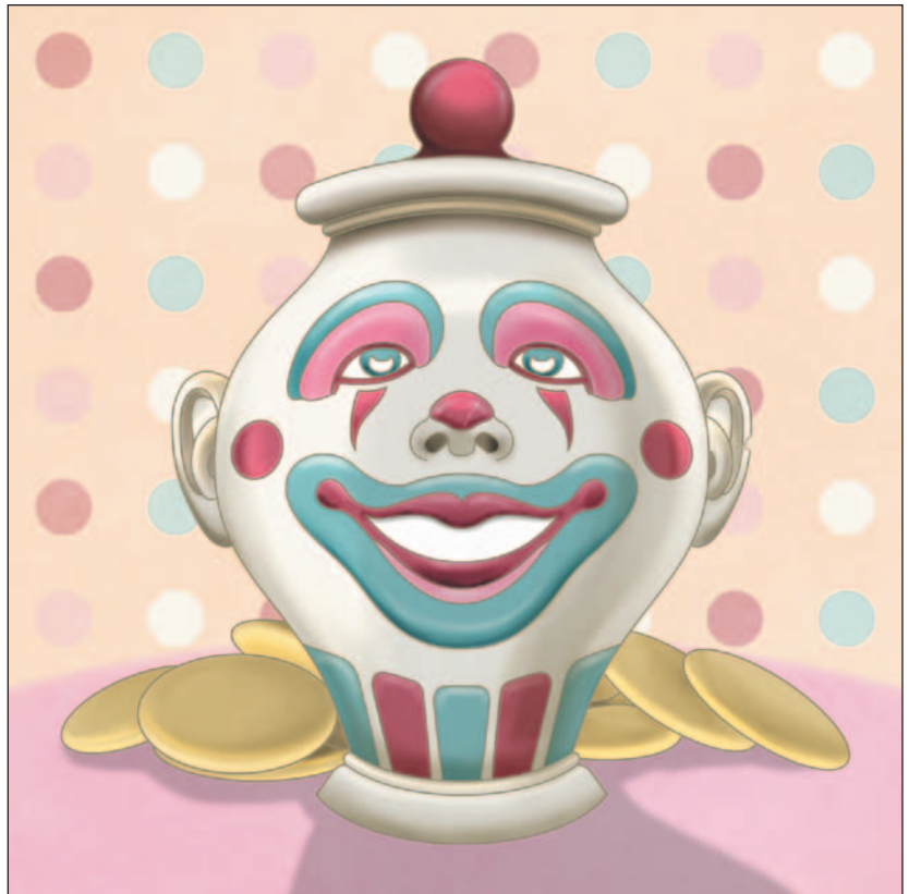
illustration : Laurine Spehner

Faire apparaître quatre biscuits à la fois était probablement trop exigeant pour une vieille jarre comme moi! La prochaine fois, je ménagerai mes forces. Mieux encore : je prendrai de l'avance et je confectionnerai mes biscuits avant l'ouverture de la banque