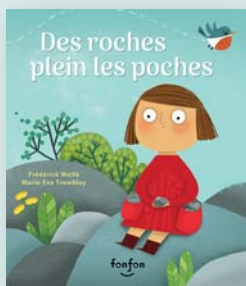
Texte: Frédéric Wolfe Illustrations: Marie-Ève Tremblay