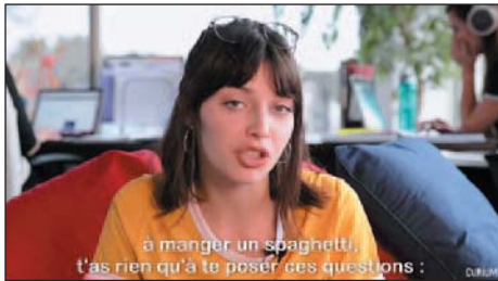
Curium en mou sur YouTube.