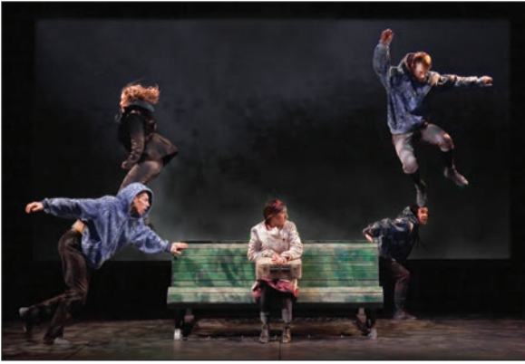
Devant moi, le ciel.