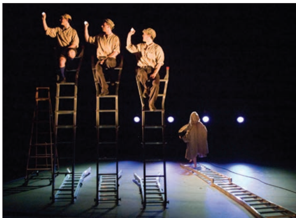
L'envol de l'ange.