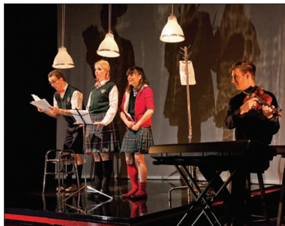
Le grand méchant loup.