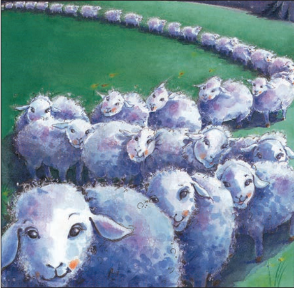
La petite fille qui détestait l'heure du dodo.

son coin de page. «Il est vieux. Mais il n'a pas froid, car il est bien emmitoufflé dans son chandail.»