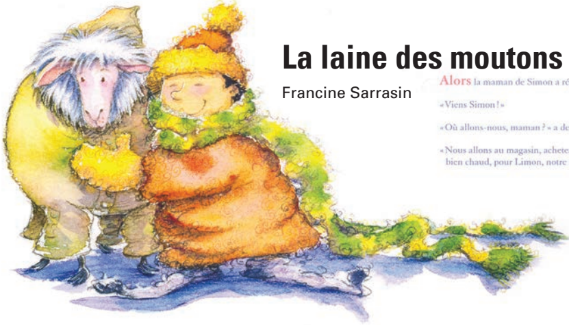
Laine et mouton.

«Nous allons au magasin, acheter un manteau, bien chaud, pour Limon, notre mouton !»