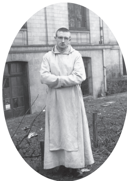
« Les cisterciens comme celui-ci ont été les premiers à battre un chemin dans le rang 8 de Val-d'Espoir. »