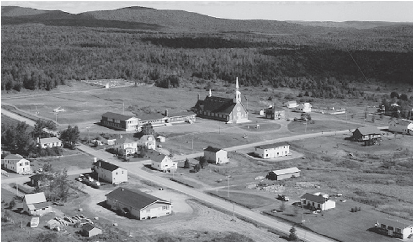
Val-d'Espoir est un village type de la période de la colonisation de l'arrière-pays gaspésien dans les années 1930.