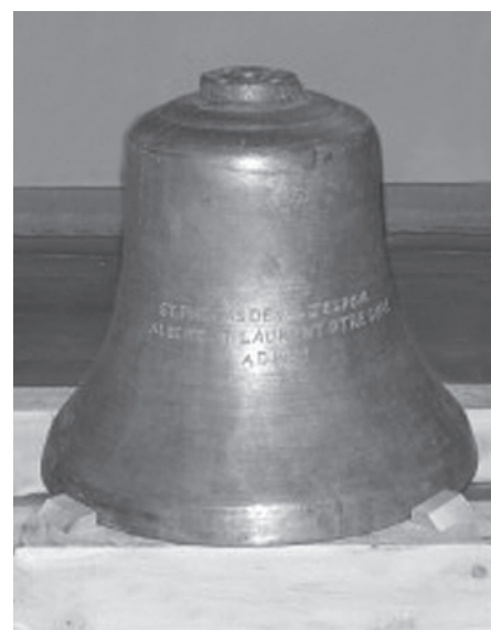
Cette cloche de la première église de Val-d'Espoir, retrouvée en 2012, est maintenant dans la nef de l'église actuelle.