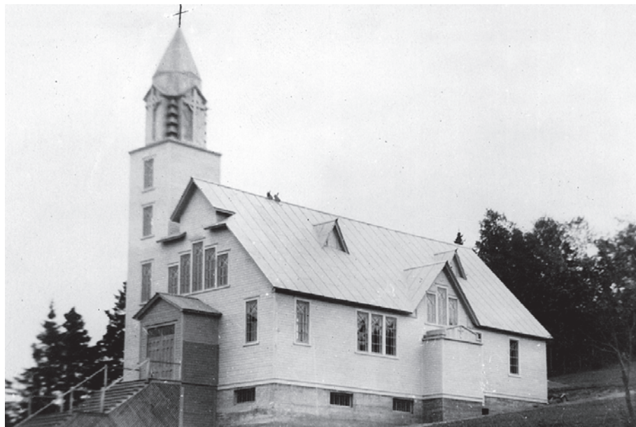
Le sanctuaire de Pointe-Navarre.

Photo : Musée de la Gaspésie. Fonds Robert Fortin. P54/1b/4/16.