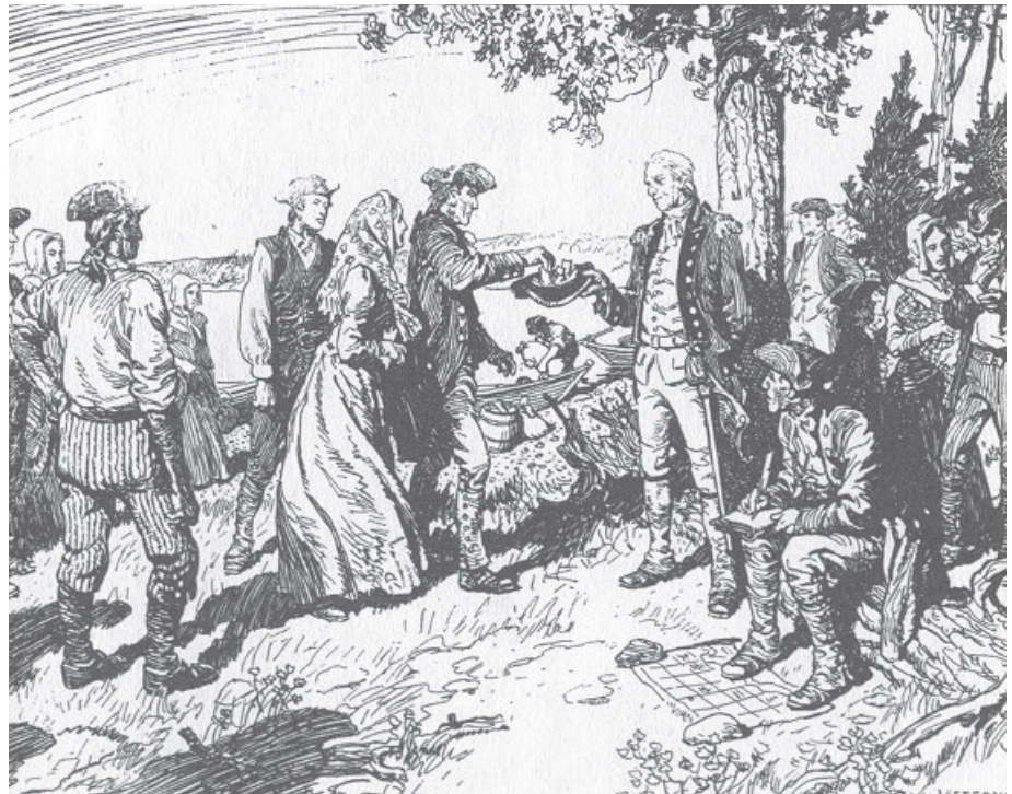
À leur arrivée, les Loyalistes réclament une chambre d'assemblée formée de députés.