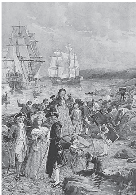
Les Loyalistes débarquent.

président de la Société Historique Machault, Pointe-à-la-Croix