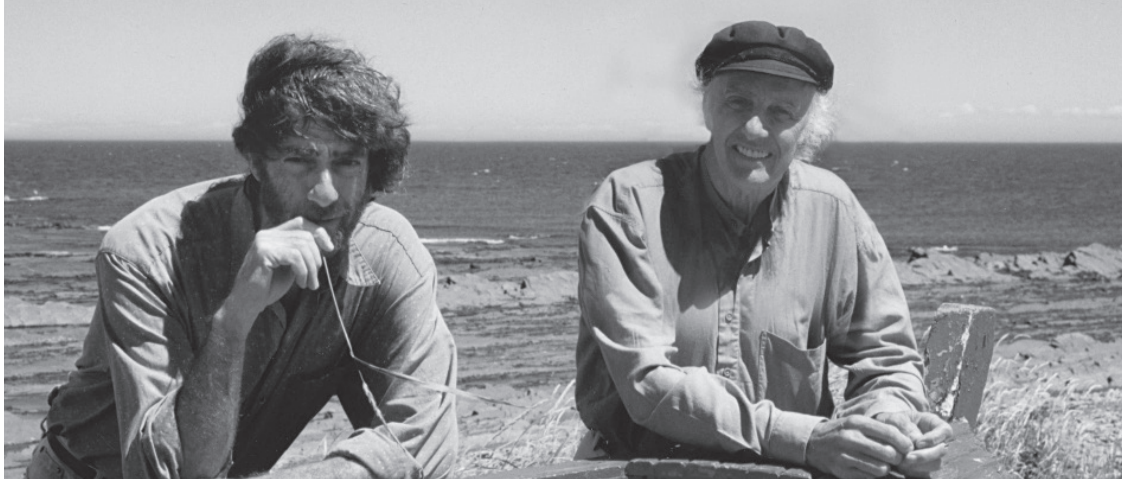
Lors de l'édition 1998 du Festival en chanson de Petite-Vallée, Plume Latraverse en est le parrain et Gilles Vigneault, le sourcier. Photo Jacques Bérubé, juillet 1998.