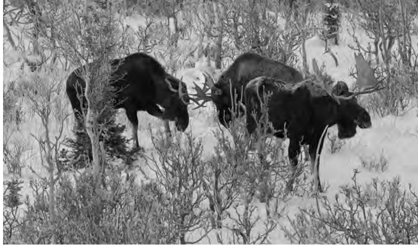
Orignaux dans les Chic-Chocs.

2014. Au Minnesota, le département des Ressources naturelles a publié des chiffres effarants : la population d'orignaux a chuté de 52 % depuis 2010. La chasse a donc été interdite dans l'état, où l'orignal est désormais une espèce sous haute protection. « Global warming is killing moose! » annoncent des biologistes américains.