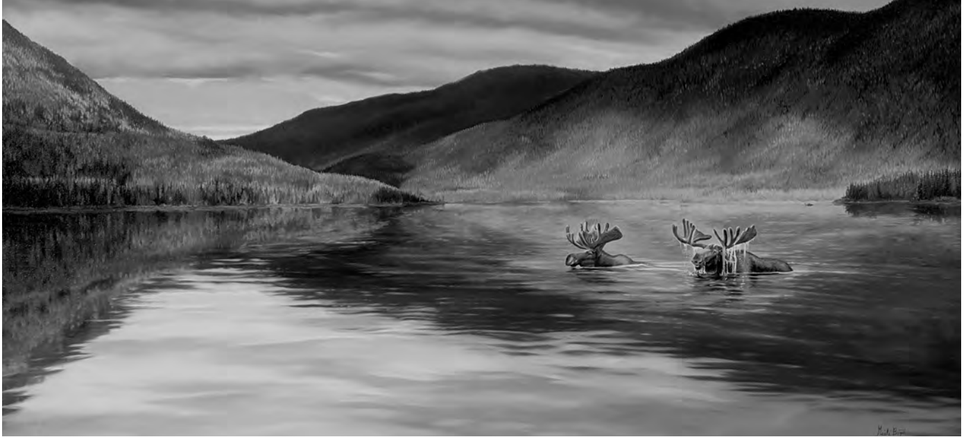
Soir – orignaux mâles au lac Paul, parc national de la Gaspésie Œuvre : Huile sur toile © Gisèle Benoit.

se raréfie et le caribou des bois disparaît lentement depuis la création du parc de la Gaspésie, en 1937.