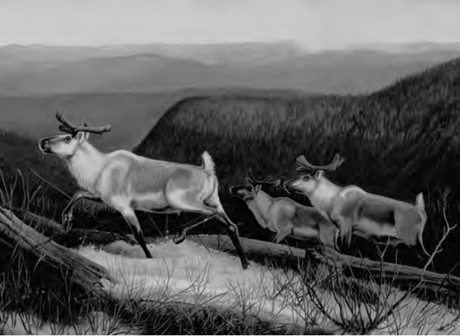
En route vers les sommets – Caribous des Chic-Chocs Œuvre : Huile sur toile © Gisèle Benoit.