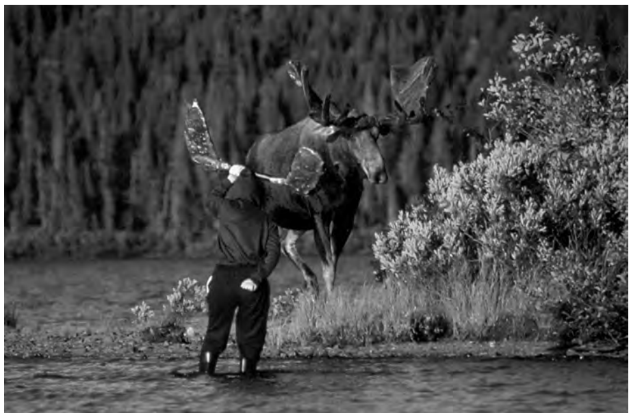
Une scène fameuse du documentaire En compagnie des orignaux , produit en 1993.

Au Québec, spécialement en Gaspésie, la faune est soumise à des pressions constantes allant à l'encontre des recommandations des scientifiques, qui exhortent le gouvernement à créer davantage de zones protégées. C'est qu'en plus du sacro-saint développement économique, au nom duquel les décideurs sacrifient tout, il subsiste dans notre société des traditions populaires et des mythes anti-évolutifs; par exemple, la croyance voulant que la chasse et la trappe soient des outils