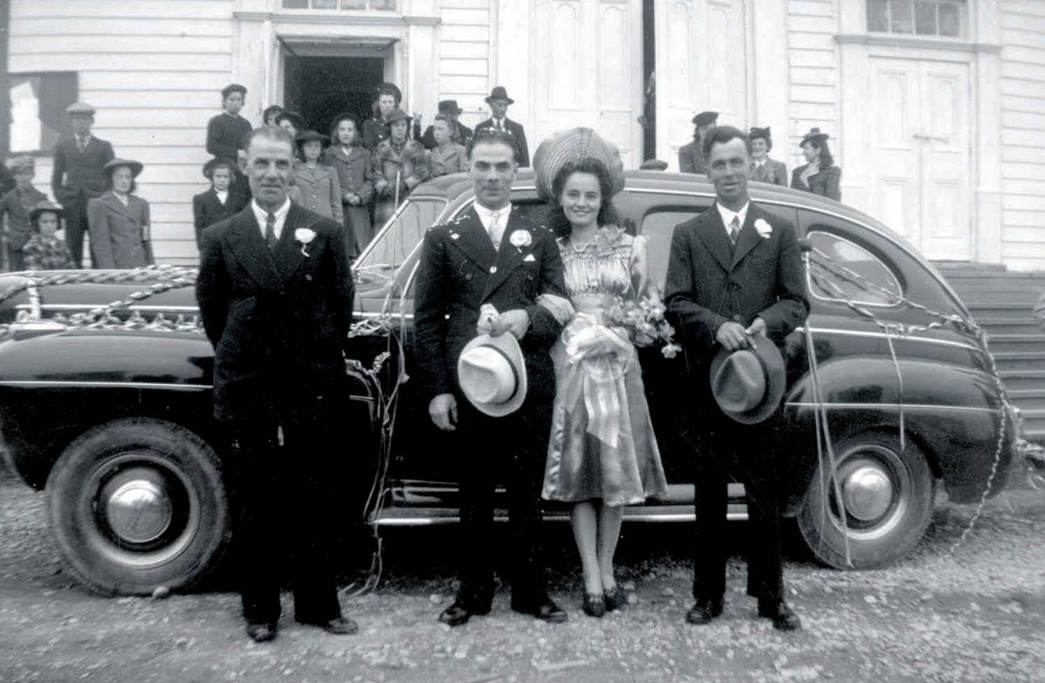
Les trois couples de mariés (sœurs Leblanc) prennent place dans de belles décapotables « Monack », une gracieuseté du garage Bert Dimock, 7 juillet 1956, New Richmond.