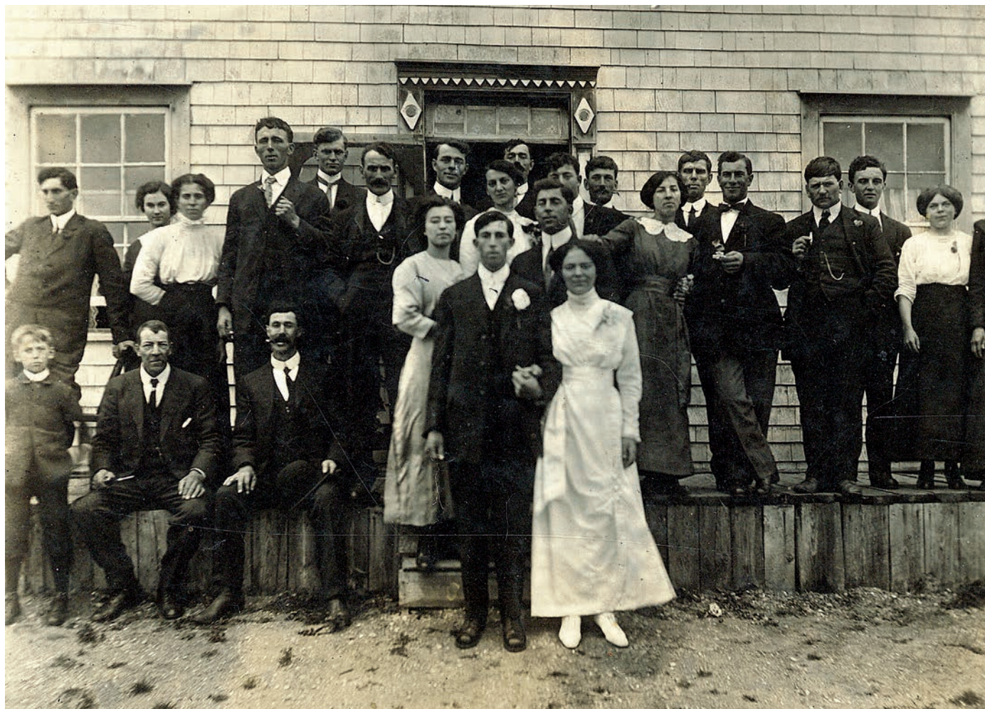
Mariage chez William Poirier à Bonaventure, vers 1900. Photo : Musée de la Gaspésie. Fonds Sylvio Gauthier. P79/6/59.