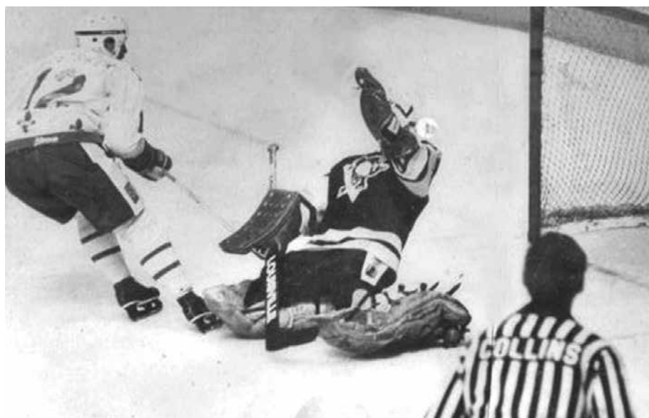
Louis Sleigher marque un but au tournoi pee wee de Québec.