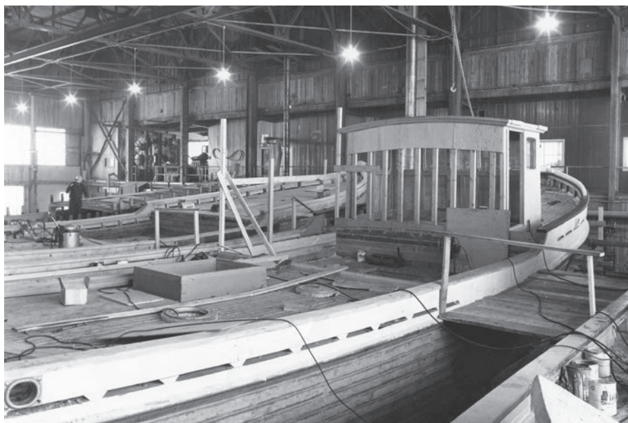
Construction d'un cordier (engin fixe) au Chantier maritime de Gaspé, filiale des P.U.Q (s.d.)