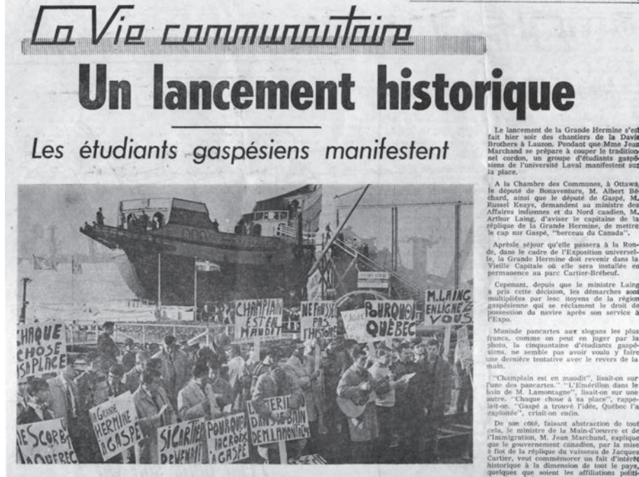
La manifestation des étudiants attire l'attention de la presse dont cet article de L'Événement du 28 octobre 1966.