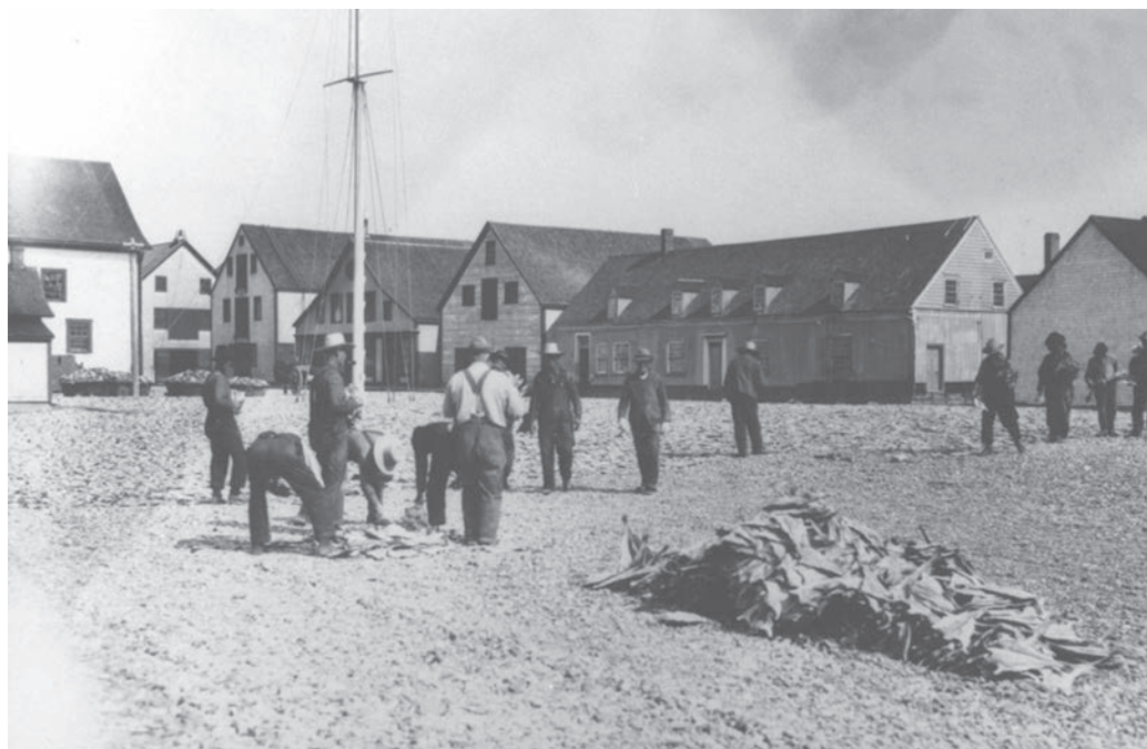
Le site de pêche de Paspébiac où on y fait le séchage de la morue attire beaucoup l'attention des journalistes.

Photo : Musée de la Gaspésie. Collection initiale. P1/16/1