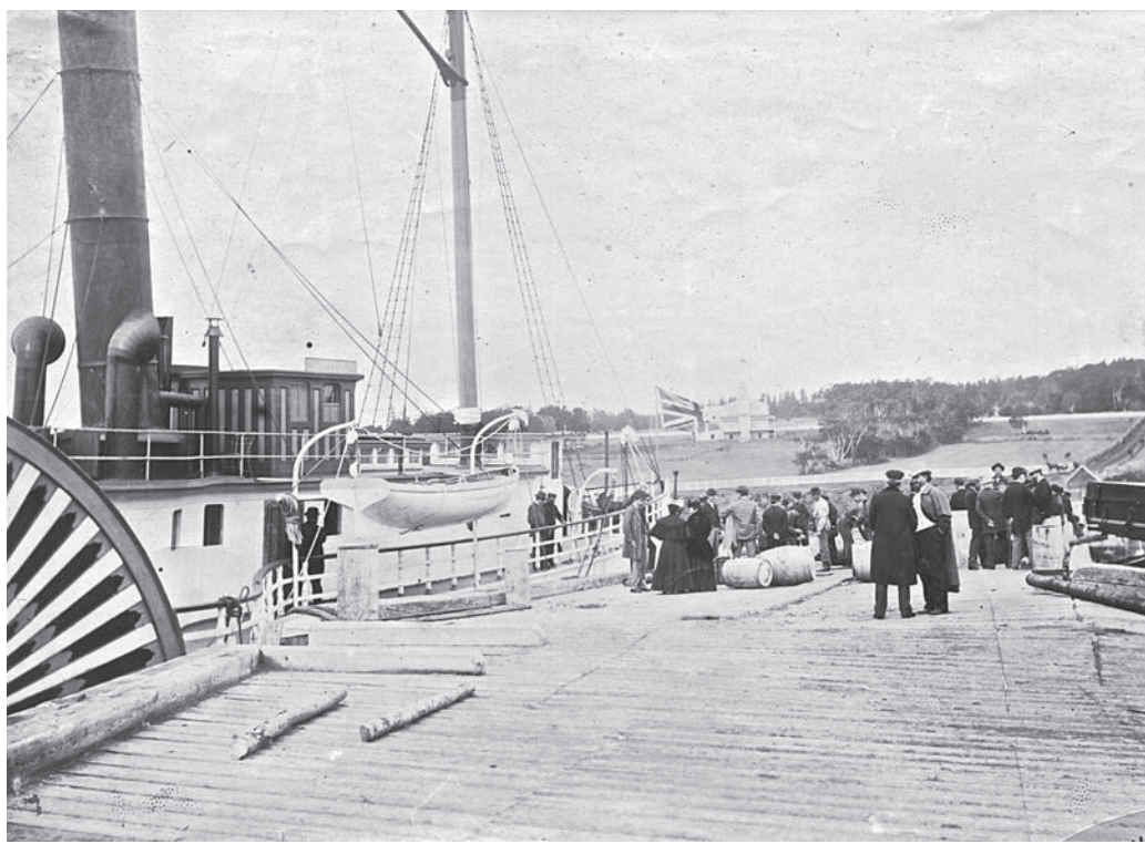
Le vapeur Admiral au quai de New Carlisle, vers 1900-1910.

Les « excursionnistes » se réunissent à Lévis où, le vendredi matin, ils prennent le train Intercolonial dans un wagon que leur a réservé la compagnie qui les mène à Campbellton où ils changent de train pour atteindre Dalhousie à 21 h. En soi, tout un périple qui se répètera dans l'autre sens. Les journalistes insistent beaucoup sur le temps que ça prend pour joindre Dalhousie, dénonçant l'absence de train et de route le