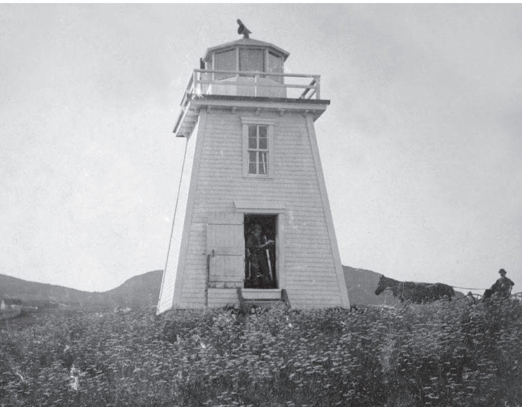
Le premier phare du cap Blanc, 1898

« Un peu plus éloigné l'on remarque le Cap Blanc avec sa tour et son phare lumineux. Le tout forme un spectacle grandiose et imposant 1 . »