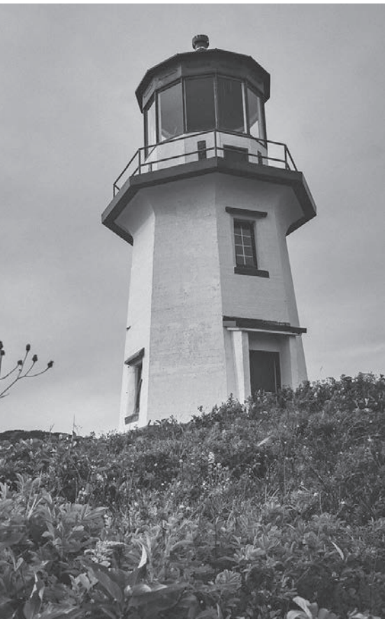
Le phare actuel du cap Blanc, 2014