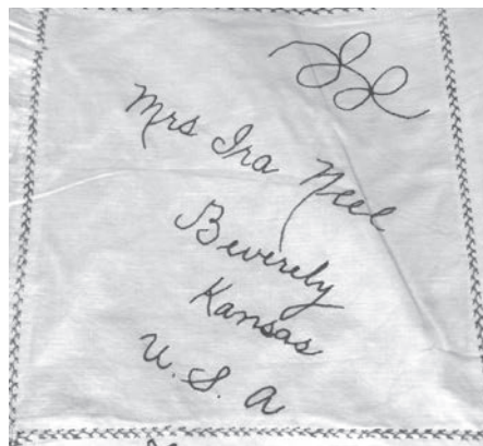
La courtepointe est une véritable création collective internationale puisque des pièces proviennent de femmes de la Gaspésie, du Québec et de plusieurs endroits des États-Unis, cette pièce venant du Kansas.

« Vers 1900, des dames anglophones de la région de Montréal, membres de la Woman Art Society, organisent un voyage en Gaspésie. Elles constatent sur place la richesse des arts domestiques et le danger que représentent les catalogues des compagnies qui offrent des marchandises en abondance. Ces publications auraient tendance à annihiler, à plus ou moins long terme, les diverses activités créatrices. En 1906, ces dames fondent une société à charte, The Canadian Handicrafts Guild, dont les buts sont de développer et faire revivre l'artisanat, de sensibiliser le grand public à la richesse et à la beauté des œuvres faites à la main, d'organiser des expositions, de monter un centre de documentation sur le sujet et d'élaborer une collection permanente de pièces 1 . »