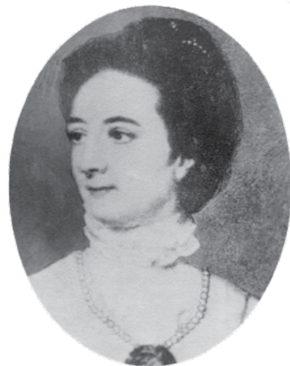
Lady Maria Carleton, née Howard, épouse de Guy Carleton.

Carleton est nommé en mars 1782 commandant en chef des forces britanniques en Amérique du Nord,