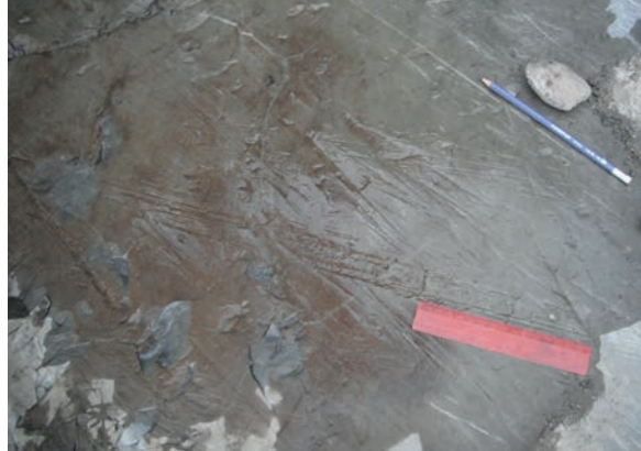
Socle rocheux poli et strié par le passage des glaciers en Gaspésie, 2011.

C'est la toundra qui a d'abord recouvert la péninsule, le climat étant encore influencé par les glaciers à proximité. Certaines espèces de plantes arctiques-alpines héritées de cette période colonisent encore les milieux les plus hostiles de la Gaspésie où elles ont pu perdurer sans trop de compétition. Les sommets des monts Albert et Jacques-Cartier, dans le parc de la Gaspésie, ainsi que les falaises maritimes du parc national Forillon en sont les exemples les plus connus. Les arbres ont migré peu à peu vers nos latitudes pour prendre la place de la toundra. La