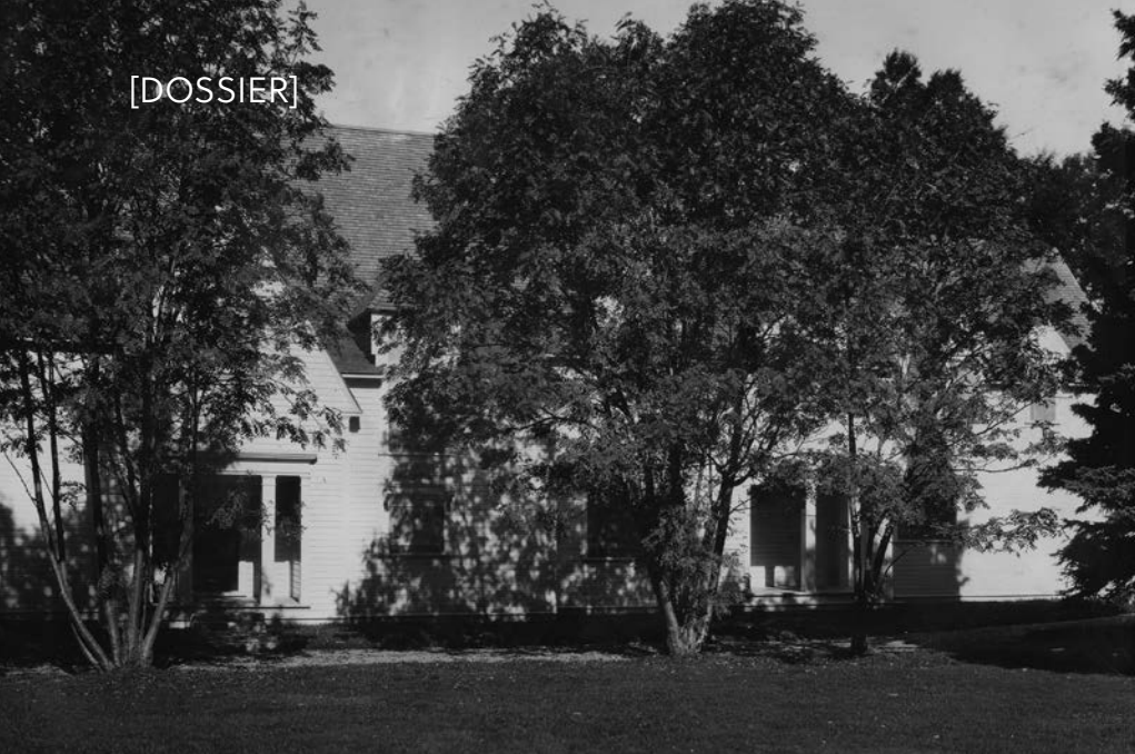
Maison des Dawes, 1930. Le crime se déroule dans cette prestigieuse résidence d'été. Cette photo a été utilisée lors du procès.