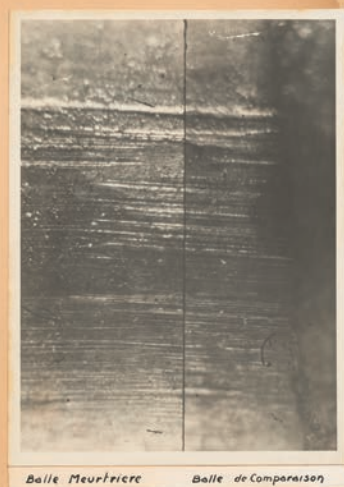
Balle Meurtrière Balle de Comparaison