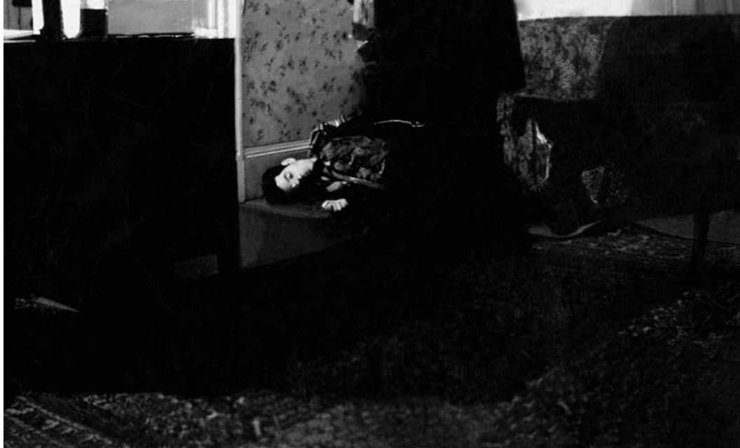
Photographie de la scène de crime au Lodge, 20 novembre 1936. La victime est couchée sur le tapis, la tête près du mur. Cette photo de scène de crime est la seule que nous ayons trouvée; datant des années 1930 et prise par le photographe Gérard, elle constitue une rareté historique, c'est pourquoi nous avons choisi de la publier.