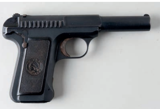
L'arme utilisée est un pistolet Savage comme celui-ci.

Le procès de Carter va débuter le 15 juin 1937 au palais de justice de Québec devant l'honorable juge Lucien Cannon. Les procureurs de la Couronne sont M e Léonidas Cloutier,