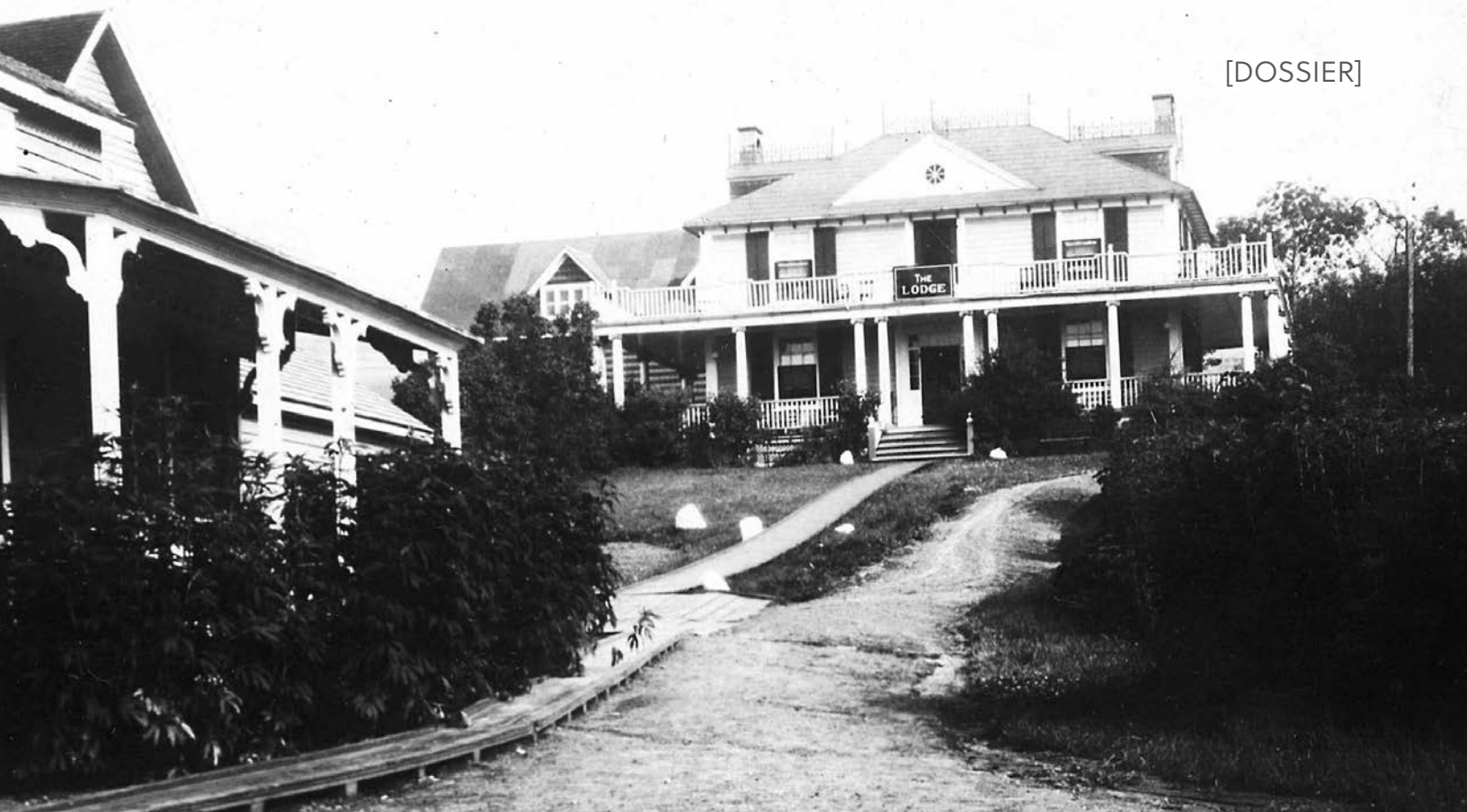
Le Baker's Lodge, lieu de résidence de Kingsley Carter et lieu du meurtre, entre 1925 et 1935. Le bâtiment à gauche est l'hôtel Baker. Musée de la Gaspésie. Collection Abbé Grenier. P288/48