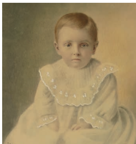
Jeune enfant inconnu.

Pastel et aquarelle Musée de la Gaspésie