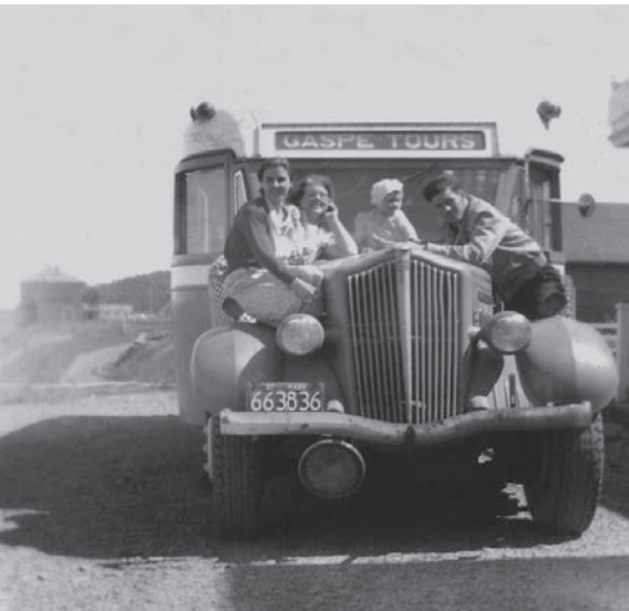
Un autobus de Tauk Tours devant le Bon Accueil, 1937.