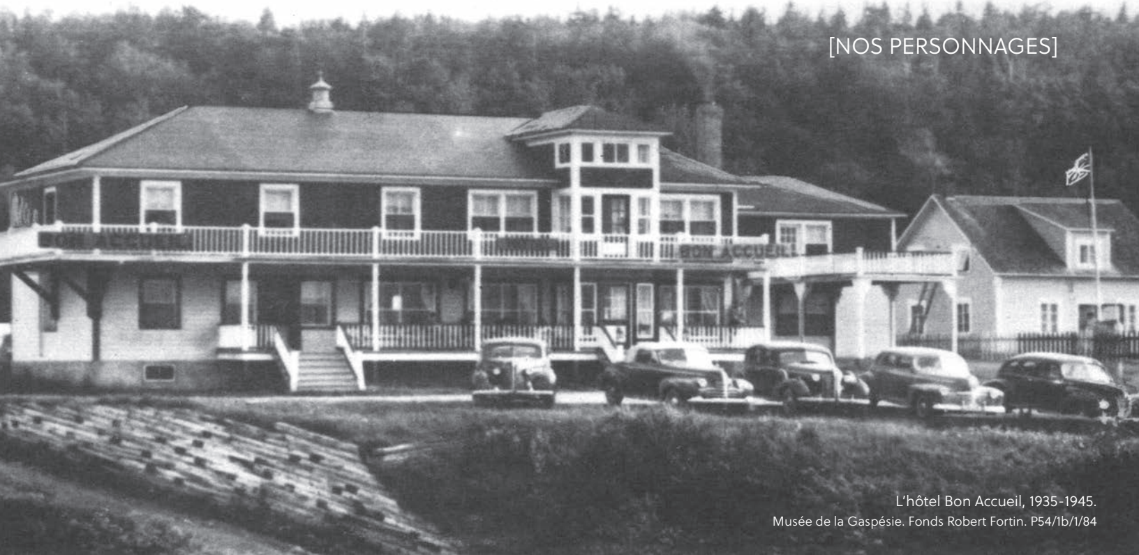
L'hôtel Bon Accueil, 1935-1945.