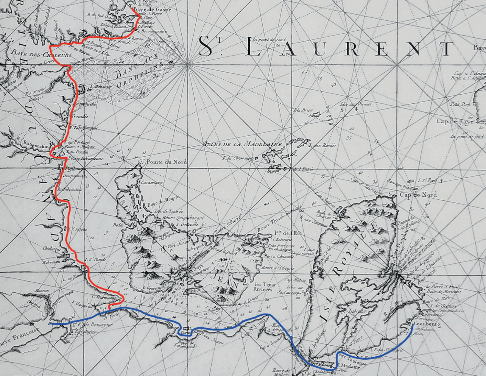
Détail d'une carte du golfe du Saint-Laurent, 1764; cette carte est la plus ancienne que possède le Centre d'archives du Musée de la Gaspésie. La première partie du voyage d'Arceneau y est tracée en rouge et la deuxième partie en bleu. Musée de la Gaspésie. Centre d'archives de la Gaspésie. P57/5/1

Nicholson, qui est de passage en Nouvelle-Écosse, en présence de plusieurs officiers britanniques. Sa déposition orale est sans doute traduite et transcrite par Paul Mascarene, un huguenot français capitaine dans l'armée britannique, seul francophone présent lors de son témoignage.