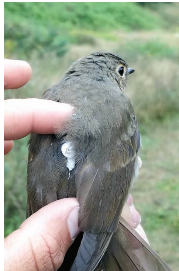
Grive à dos olive équipée d'un émetteur ultraléger, 2020. © Francis Bordeleau-Martin