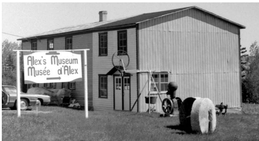
Alex Coffin ouvre durant quelques été son musée à Peninsula (Penouille). P1/6/6.