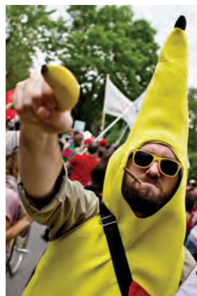
Banane Rebelle en 2012