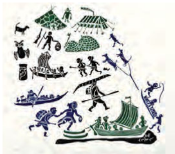
Détail de la couverture