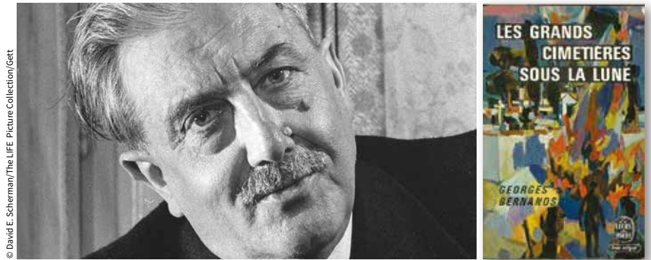
Georges Bernanos en 1946

fournit la liste) cautionnant les tueries et bénissant les canons de Franco et de ses sbires. Bernanos horrifié dénonce les atrocités commises au nom de la croisade antibolchevique. Pour le lecteur d'aujourd'hui qui n'a pas une connaissance précise de la France politique d'avant-guerre, le livre est parfois peu intelligible, bien des références et allusions lui échappent, noyées dans un discours diffus et répétitif. Inlassablement