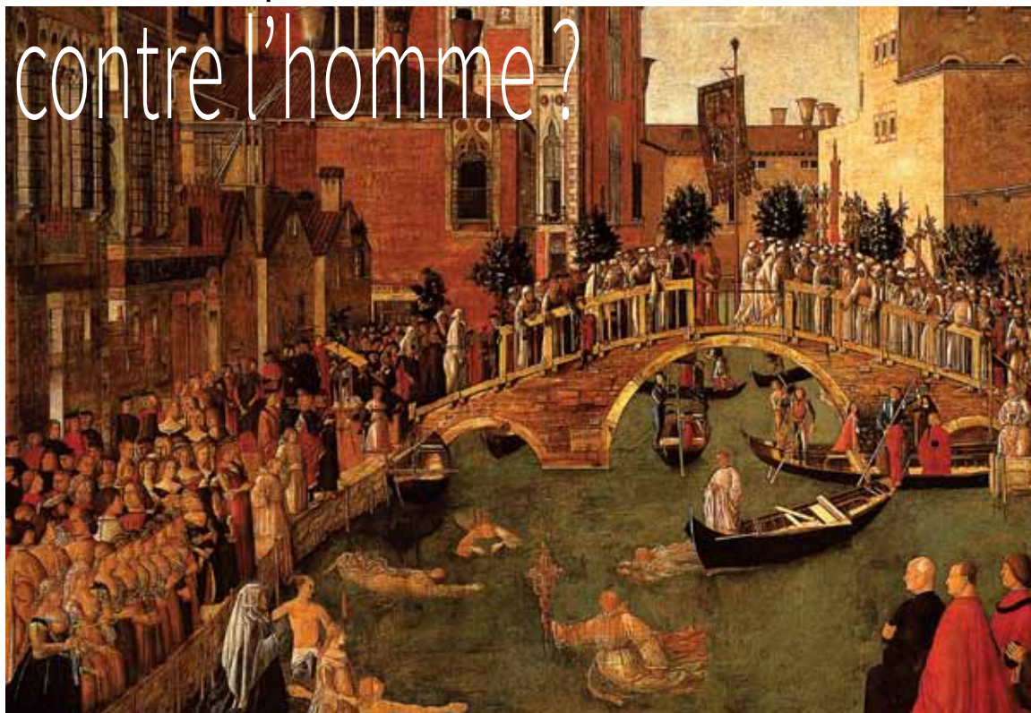
Miracle de la Croix au pont de San Lorenzo (Gentile Bellini, vers 1500).