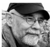
Par JEAN DÉSY*

Ma Côte-Nord commence à Franquelin Souvenir d'une centaine de moyacs cancanantes Folles de vie-février dans un chorbac Puis il y a Pentecôte et sa gueule de rivière Lieu de haute puissance pour se métamorphoser En truite de mer ou en flétan Dix kilomètres plus loin c'est Baie-des-Homards Et ses masses de moules et de myes Sans compter les crabes et les homards succulents