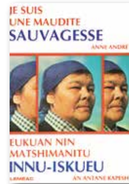
..... Première édition de 1976

Tout le récit montre la difficulté de l'imposition d'un système à un autre. Il fait aussi voir le côté que l'on a très peu vu ou lu dans toute l'oppression de la colonisation : la pensée d'une femme innue née dans le Nutshimit qui a vu ses enfants envoyés au pensionnat ainsi que l'installation impérialiste des nouveaux venus. Tout le récit démontre la fierté et la certitude de la valeur d'une culture. Il nous fait voir, en même temps, l'adaptation à un changement de mode de vie radical pour un peuple près de la nature et nomade. Kapesch fait le plaidoyer ultime du mode de vie traditionnel, dans le bois, comme étant le meilleur pour les Innus.