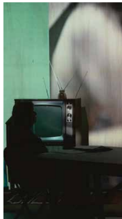
Nicole Brossard, à gauche, Le désert mauve

Lors de cet atelier, on a beaucoup parlé de littérature hors le livre. Hors le livre comme on dit hors-la-loi, parce que ça