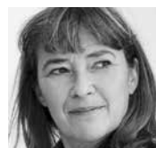
Par MICHELLE CORBEIL*

Qui sont les publics des arts littéraires de la scène ? Quel est leur profil ? Comment peut-on les rejoindre ? Quelles sont les particularités régionales en matière de publics des arts littéraires ? Nécessaires préludes à la circulation des œuvres, ces questions interrogent autant leur esthétique que leur mise en marché.