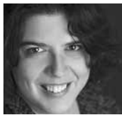
Par CATHERINE VOYER-LÉGER*

En entamant la plénière, lors du dernier segment de Paroles vivantes, nous avons comme objectif de discuter de trois questions soulevées lors des échanges précédents et sur lesquelles, nous semblait-il, le groupe pouvait espérer s'entendre. Je me propose de faire un bref retour sur ces trois sujets.