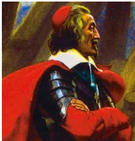
Le cardinal de Richelieu

Le comte de Moret/Le Sphinx rouge , II, 11, p. 244.