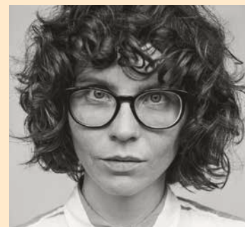
Jean Price-Mars, p. 57