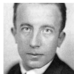
Paul Éluard en 1930

L'entreprise d'Antoine Volodine est unique dans le paysage littéraire français. Son dernier, publié sous le pseudonyme de Lutz Bassmann, Danse avec Nathan Golshem (Verdier), construit comme ses précédents livres un univers absurde, parfois squelettique, noir, à la limite du comique, dans lequel les héros cherchent désespérément une voie de passage.