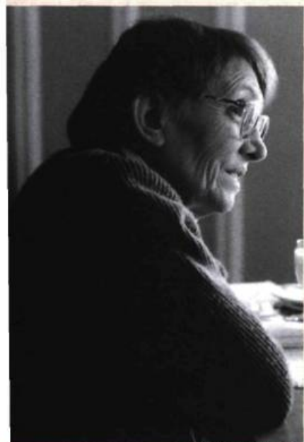
Annie Saumont, 1994

Annie Saumont n'aime pas écrire de façon linéaire et classique. Dans certaines nouvelles, elle n'hésite pas à déployer différents points de vue narratifs qui se fondent les uns aux autres et provoquent ainsi un effet de prisme qui restitue une tout autre image de la réalité, souvent plus absurde, plus insoutenable et, n'était de l'humour, certaines nouvelles nous feraient l'effet d'un véritable coup de poing. « L'humour permet d'enlever un peu de poids aux choses souvent assez horribles que je raconte. Et puis ça donne une certaine tonicité à l'histoire parce