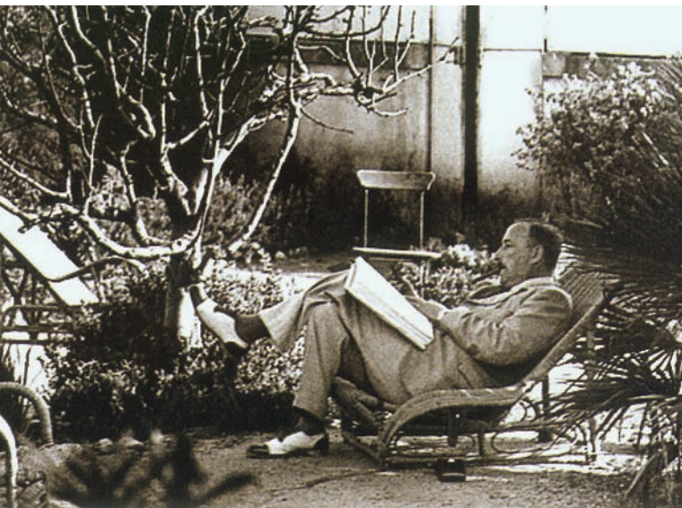
Stefan Zweig au Brésil