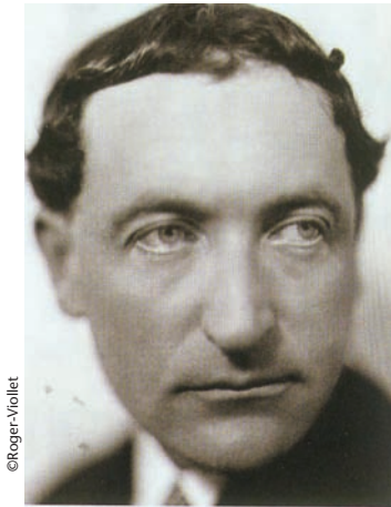
Jules Romains, l'une de ses amitiés françaises

On comprend mieux, maintenant, les ramifications qui lient les dernières œuvres de Zweig à leur contexte historique. Les années 1932-1942 correspondent à une période où Zweig a beaucoup travaillé, en partie par « nécessité extérieure » (le gouvernement autrichien avait gelé ses avoirs bancaires), en partie par « désespoir intérieur ». Rédigeant ses biographies de Marie-Antoinette et de Marie Stuart, ses essais sur Érasme, Magellan et Montaigne, de même que ses souvenirs ( Le monde d'hier ), travaillant à son Balzac qu'il percevait comme son grand œuvre mais qui devait rester inachevé, Zweig a cherché dans l'histoire des motifs de consolation. Incurablement nostalgique d'un héritage des Lumières que la barbarie du XX e siècle venait d'anéantir, Zweig a