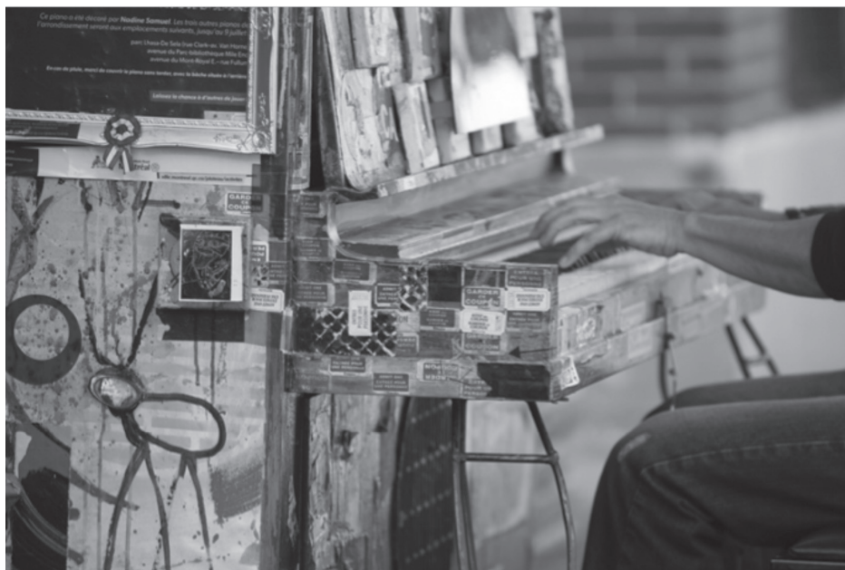
Piano urbain. Photographie de Judith Trudeau

Le système tonal, en fonction duquel la musique s'organise autour d'accords et de gammes majeurs et mineurs, a constitué le plus important moyen d'organisation de la musique occidentale de 1600 à 1900. Dans la foulée de la quête de liberté créatrice qui anime les peintres du début du XX e siècle, Schoenberg et les compositeurs de la seconde école de Vienne vont développer, dans les années 1910, une musique atonale, c'est-à-dire échappant aux règles traditionnelles d'organisation et de résolution des accords. Du coup, chaque note peut être suivie de n'importe quelle autre, au gré du compositeur. Cette liberté totale, déjà anticipée par Franz Liszt dans sa Bagatelle sans tonalité (1885), sera pleinement assumée par Schoenberg avec Pierrot lunaire (1912).