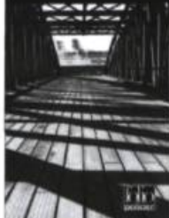
Jean-Claude Izzo Chourmo