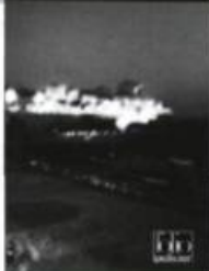
Jean-Claude Izzo Soléa