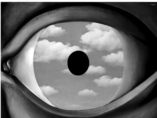
René Magritte, Le faux miroir , 1928.

à lui-même, à son identité trouble : « devant cette maison que plus rien ne me permettait de qualifier de paternelle, je craignis soudainement qu'on ne me tendît un miroir et que j'y aperçusse un visage que je ne reconnaîtrais pas 9 . »