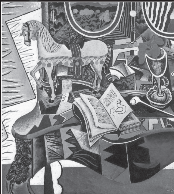
Joan Miró, Horse, Pipe and Red Flower , 1920.

Je me lance dans une entreprise [la description de la nouvelle] que je sais vouée à l'échec puisqu'il me plaît de considérer que la nouvelle est incompatible avec l'analyse in vitro. Terriblement vivante, elle reconduira, par son renouvellement, mes propos à leur caducité inéluctable.