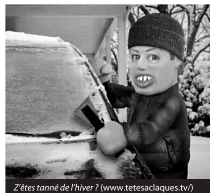
Z'êtes tannée de l'hiver ? ( www.tetesaclaques.tv/ )