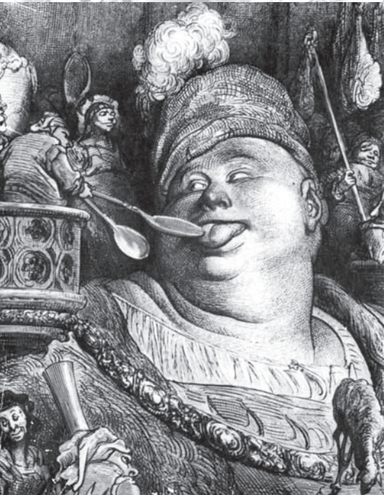
Gargantua par Gustave Doré.