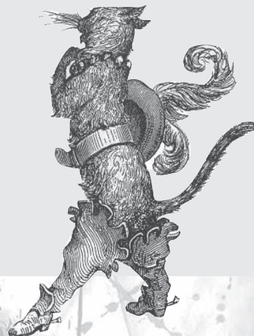
Le Chat botté par Gustave Doré.