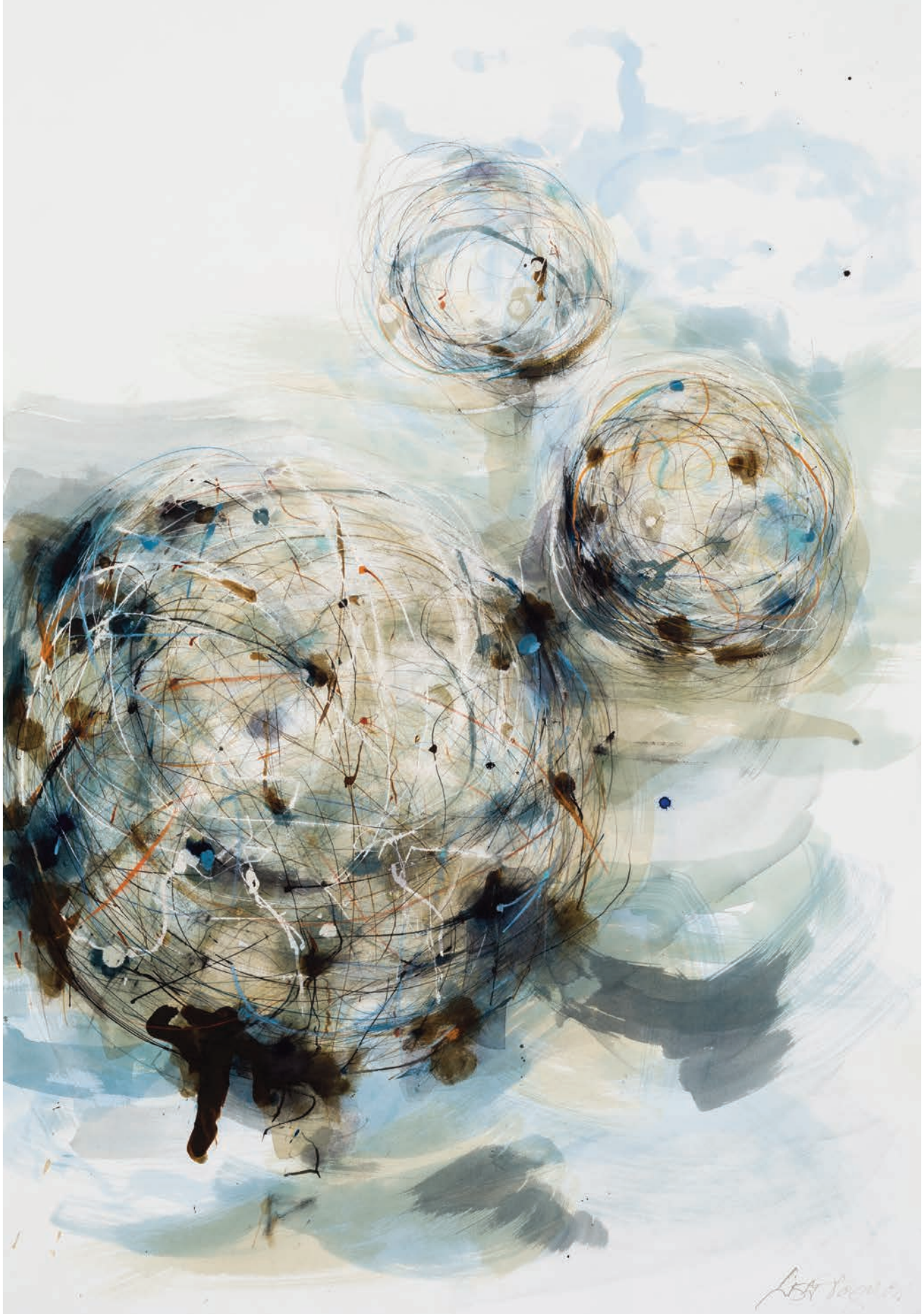
Lisa Tognon, Valse , 2014, encre sur papier. Artiste invitée du n° 760 (novembre 2012).