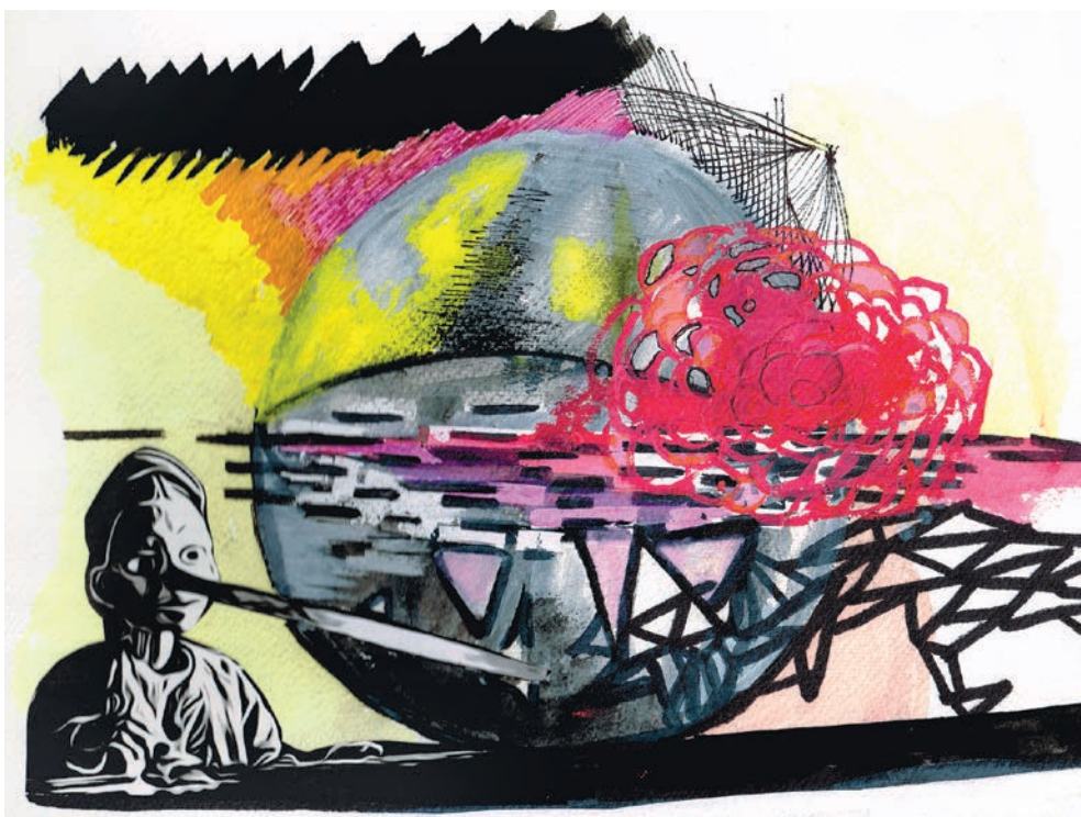
Véronique Doucet, Fin de l'ère Pinochio , 2016. Artiste invitée du n° 751 (septembre 2011)

Les mouvements sociaux, les intellectuels, les médias alternatifs, entre autres, répliquent et, devant la destruction des