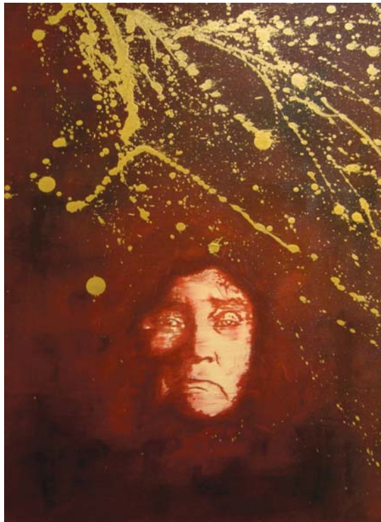
Eruoma Awashish, Matcaci (« Au revoir »), triptyque, 2012, acrylique sur bois