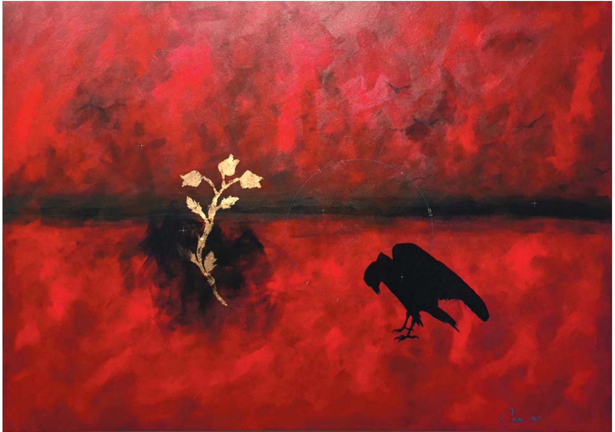
Eruoma Awashish, Rupture , 2015, acrylique sur toile et feuilles d'or

la nature doit nous inspirer, il faudrait bien se garder de la transformer en fétiche, au risque de les enfermer dans la représentation occidentale du « bon sauvage ». Le faire nierait au passage l'incroyable diversité des centaines de peuples qui habitent ce continent de même que la complexité de leurs cosmogonies et modes d'appropriation du territoire respectifs. Ce serait aussi faire fi du fait que ces peuples sont autant confrontés que tous les autres à la modernité capitaliste et à la tentation d'emprunter, comme nous, la voie du « développement » et ses promesses de progrès parfois trompeuses.