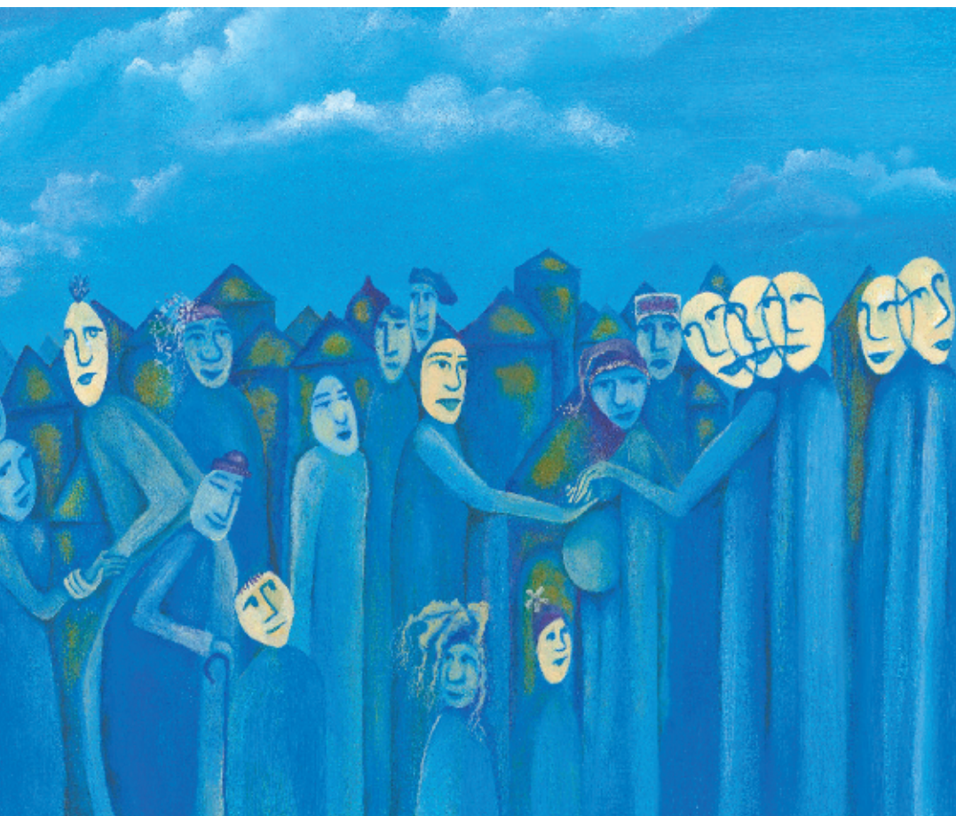
Pamela Witcher, S'unir. Réfléchir. Agir. L'avenir est entre nos mains , 2005, acrylique sur toile, 38 x 63,5 cm

dantes sont unies entre elles par une langue, une histoire et une culture qui leur sont propres? Que bon nombre de ces personnes dites déficientes auditives, à des lieues de se percevoir comme handicapées, revendiquent le statut de minorité culturelle et linguistique et se disent Sourds –avec un «s» majuscule– pour marquer cette appartenance culturelle? Qui sait qu'elles ne veulent pas forcément être intégrées dans notre monde de paroles, de bruits et de musique par le biais d'appareils auditifs ou d'un implant cochléaire et qu'elles sont –même sans ces aides technologiques– des êtres sensibles, expressifs, créatifs?